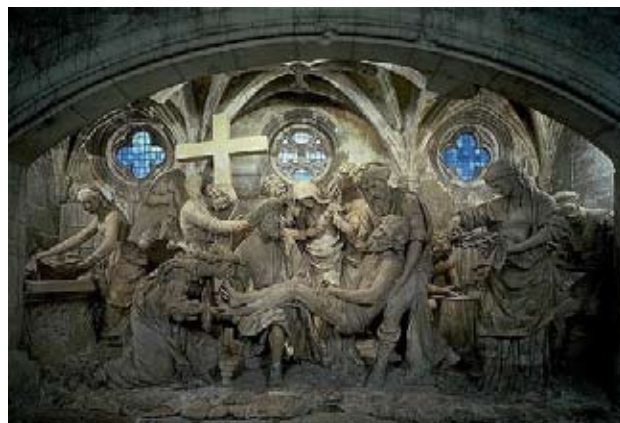
Pour les besoins de la restauration, les 13 statues ont été sorties de l'enfeu

Tout d'abord, les données numériques de la tête de la statue ont été recueillies à l'aide du scanner Handyscan 3D, ce qui a