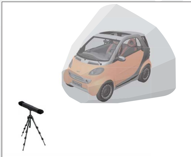
3. VUE ISOMÉTRIQUE