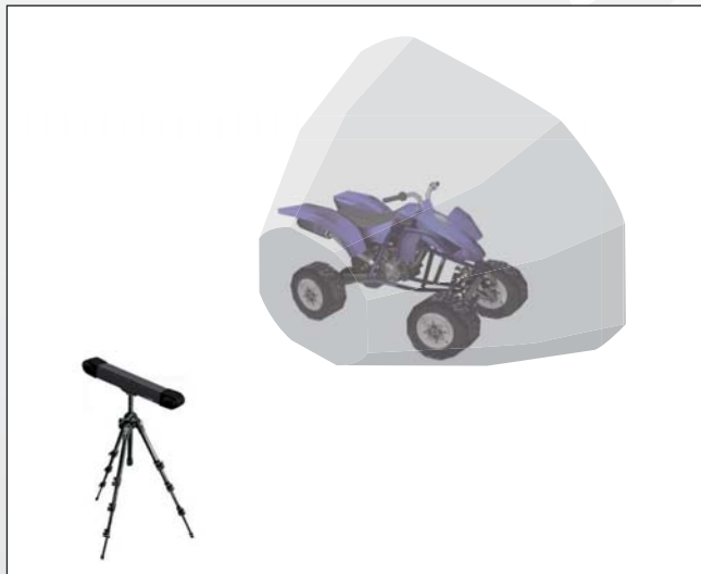
3. VUE ISOMÉTRIQUE