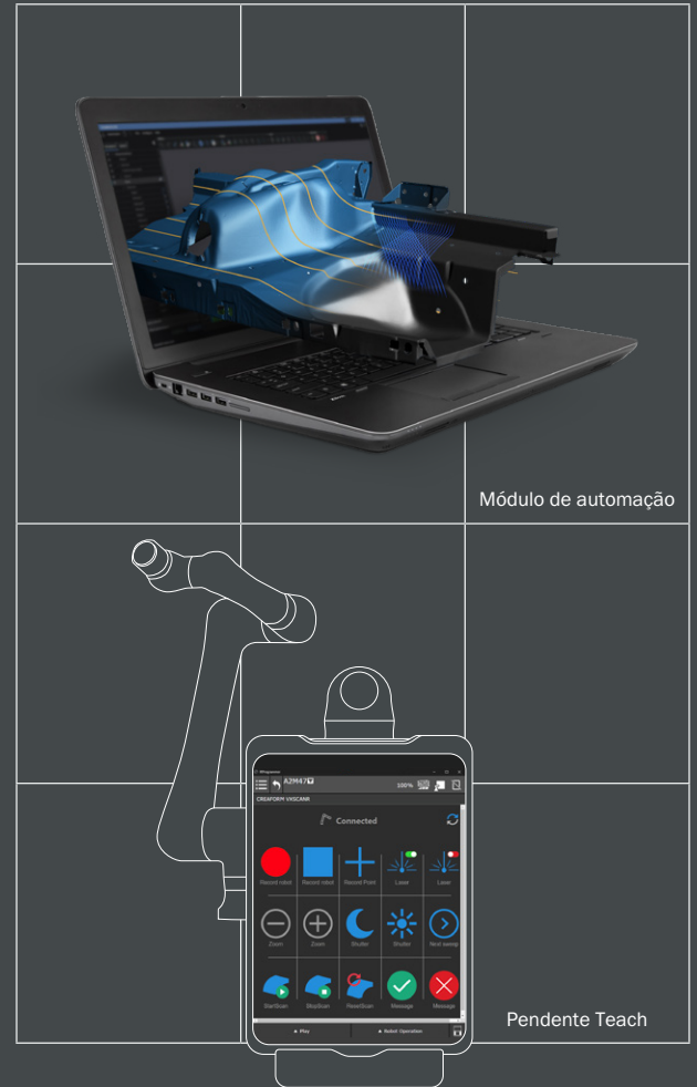
Módulo de automação

A integração otimizada do módulo de automação com Cobots (robôs colaborativos) simplifica a programação do percurso do robô, permitindo que os usuários segurem o robô e registrem varreduras a partir de digitalizações manuais ou movimentos do robô usando o pendente Teach.