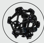
También disponible para el MetraSCAN 3D