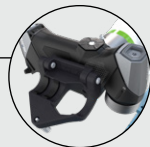
Diseño de liberación rápida: Cambio del modo automatizado al modo portátil